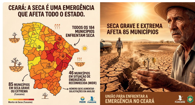
Gemini Generated Image

Cidades com o reconhecimento federal de situação de emergência ou de estado de calamidade pública podem solicitar ao MIDR recursos para ações de defesa civil. A