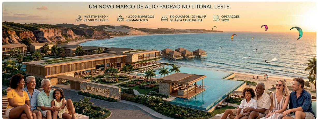
Gemini Generated Image

Com início das operações previsto para 2029, a unidade terá 310 quartos distribuídos em uma área construída de 37 mil metros qua-